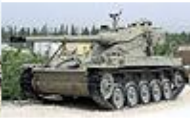
טנק שוט (צ'נטוריון)