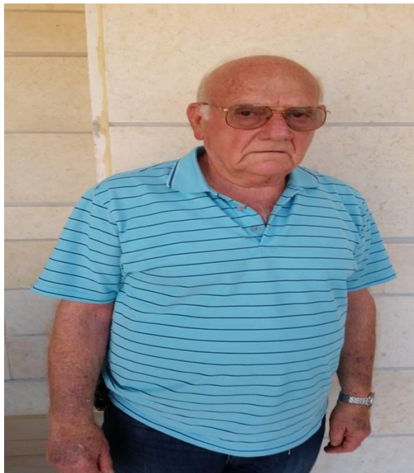
אל"מ (מיל") יוסף בר אור (בראור) - 2015