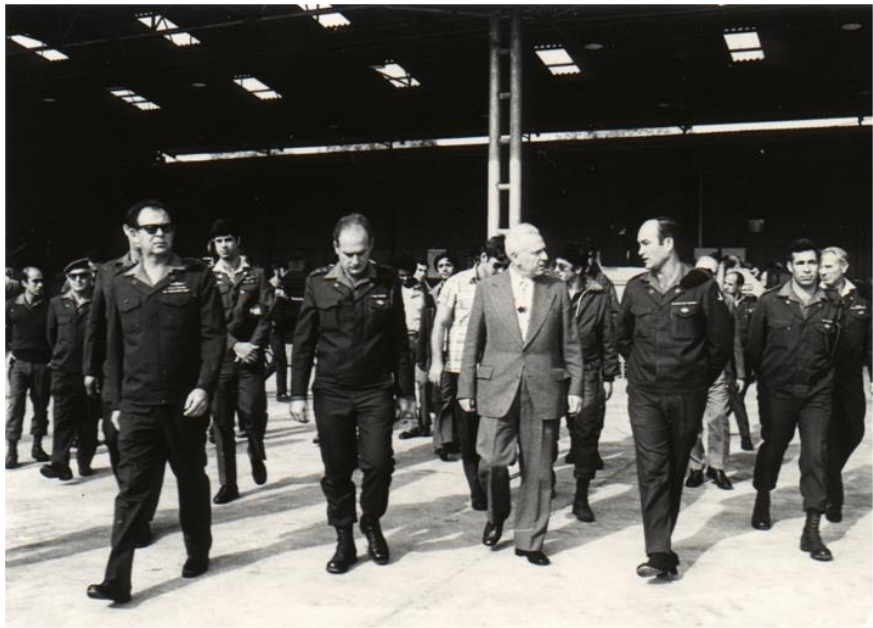
יוסף (שני משמאל, שורה ראשונה) בביקור נשיא המדינה אפרים קציר (במרכז) והרמטכ"ל מוטה גור (קצוני שמאלי).