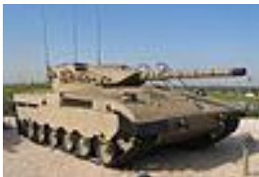
טנק מרכבה סימן 1