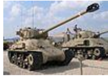
טנק שרמן M-51