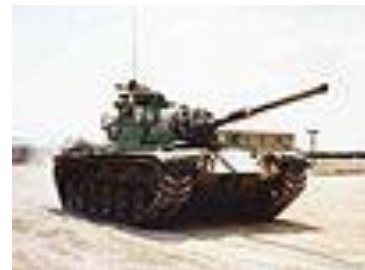
טנק מג"ח (פטון M-60)