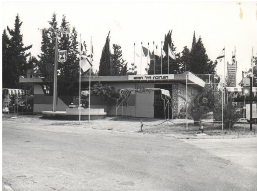
תערוכת ההדרכה של צה"ל בגני התערוכה, שארגן בה"ד 20